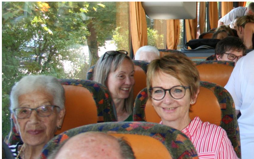
Bewohnerausflug 2018 mit Gönnerverein

Den Angehörigen wünschen wir Kraft in den schweren Stunden des Abschiednehmens.